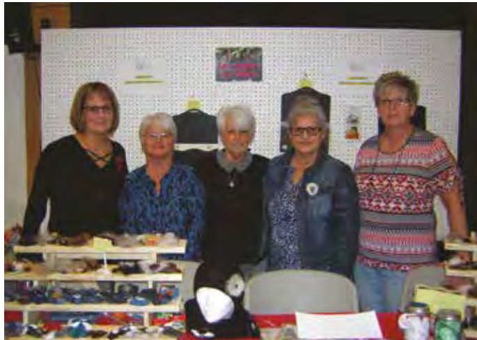
Les Dames de fleurs Marché de Noël

Merci à vous tous(tes) et à l'an prochain !