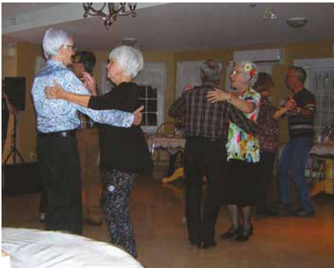
Soirée d'Halloween Chants et danse