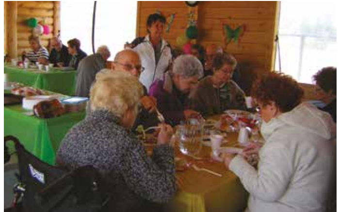
Dîner dans le gazebo